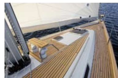
Тиковая палуба входит в базовую комплектацию