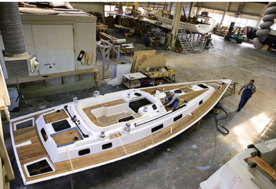
Монтаж палубного оборудования. Saare Paat строит яхты не на потоке. Палуба новой яхты будет полностью укомплектована, прежде чем ее установят на корпус

стирательная машина или сушилка. Генератор можно разместить в машинном отделении. На камбузе обе глубокие раковины мойки располагаются почти в ДП рядом с машинным отделением – при такой планировке вода из раковин будет самотеком уходить при любом крене. Помпа забортной воды может быть переключена и на подачу питьевой воды при выходе из строя помпы пресной воды. Иными словами, практичные, пришедшие из жизни решения, которые почти что вымерли в современном судостроении.