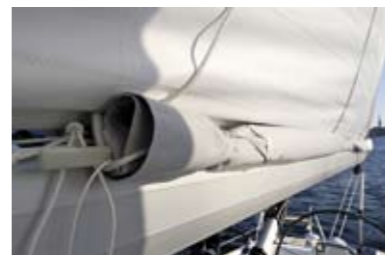
Оригинальная идея. Lazybag может быть скручен и зафиксирован