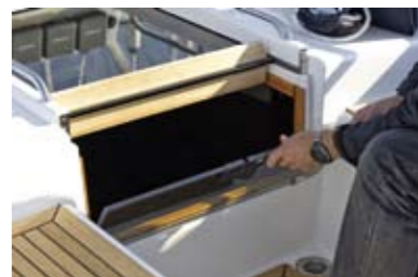
Всегда на месте. Брандер-щит крепится на петлях и удобно откидывается