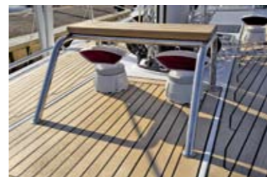
Хорошая деталь. Планка защищает вентиляторы и служит сиденьем

Измерения проведены на крейсерской скорости (80 % оборотов от максимума): 7,5 уз. при 2400 об/мин.