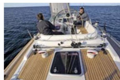
За кормовой частью кокпита в свернутом состоянии хранится спрейхуда