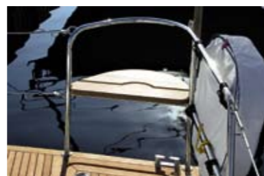
Дополнительное сиденье. Такие сиденья в «корзинах» релинга являются штатными на Saare