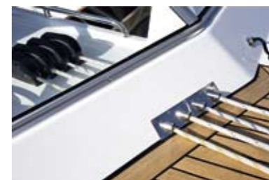
Детали из нержавеющей стали, как эти фаловые каналы, выглядят превосходно